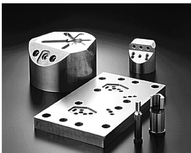
特注部品（一個づくり品）